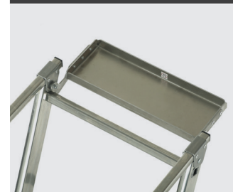
Tablette porte-outils rabattable