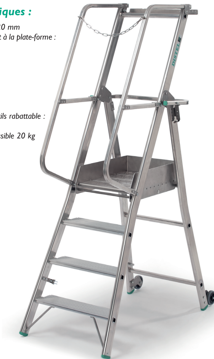
Référence : 2020/04

→ EN 131-7 DÉCRET 2008-244 R. 4323-59 A partir du 5 marches