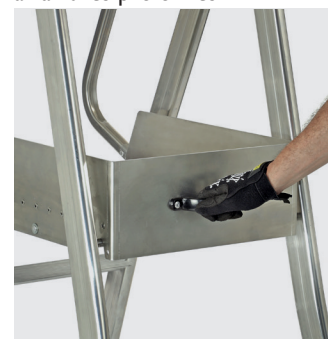
Poignée pour accompagner la manipulation du produit