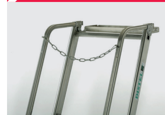
Garde-corps à 1m10 et chaînette de sécurité